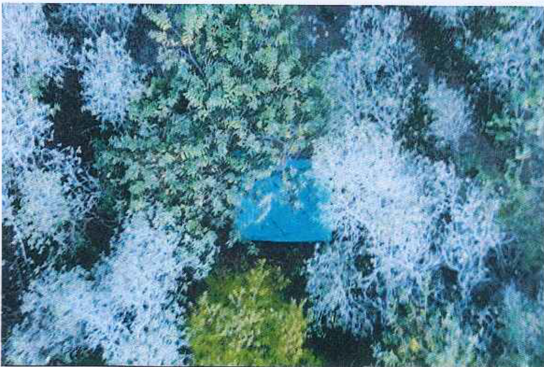
FOTO 8. Campamento permanente de cazadores locales (techo con plástico verde) ubicado en la zona de La Llanta – Volcán Sierra Negra. 22 de noviembre de 2012.