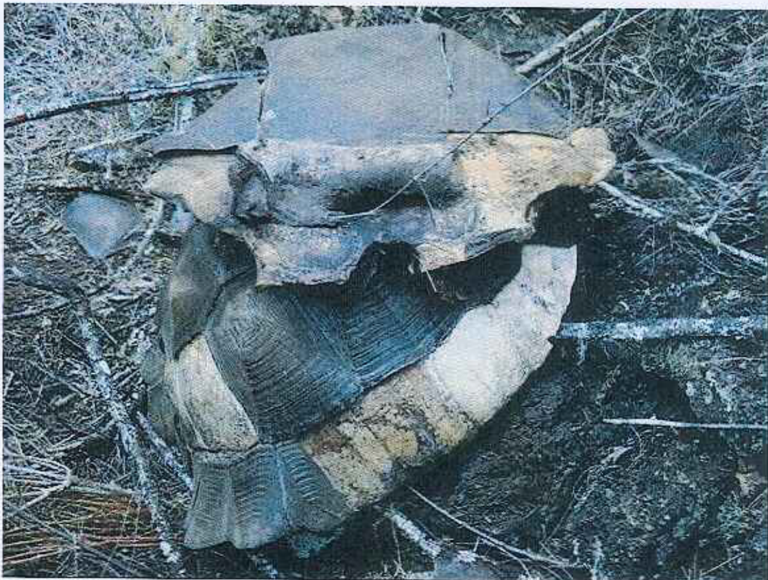
FOTO 4. Restos de tortuga gigante hembra adulta sacrificada en la zona de Cazuela – Volcán Sierra Negra (30 días de muerte). 2 de diciembre de 2008.