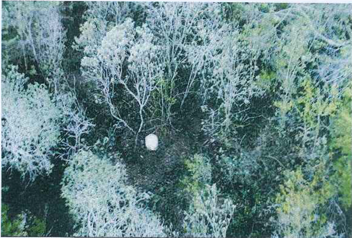
Foto 9. Restos de tortuga gigante hembra adulta sacrificada en la zona de La Lianta – Volcán Sierra Negra (15 a 20 días de muerte) a escasos metros del campamento de cazadores locales de techo verde. 22 de noviembre de 2012.