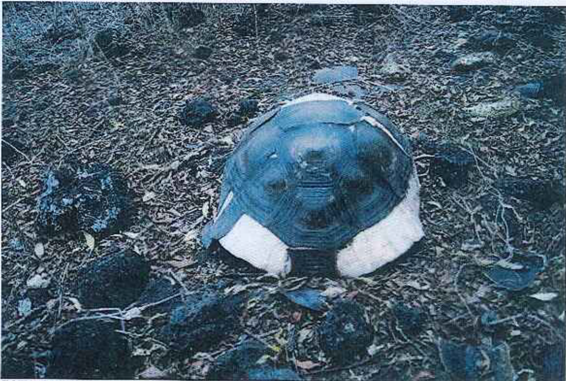
FOTO 3. Restos de tortuga gigante macho adulto sacrificado en la zona de La Lianta – Volcán Sierra Negra (15 días de muerte). 2 de agosto de 2012.