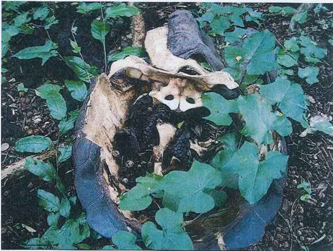
FOTO 7. Restos de tortuga gigante hembra adulta sacrificada en la zona de San Pedro – Volcán Sierra Negra (15 días de muerta). 20 de julio de 2011.