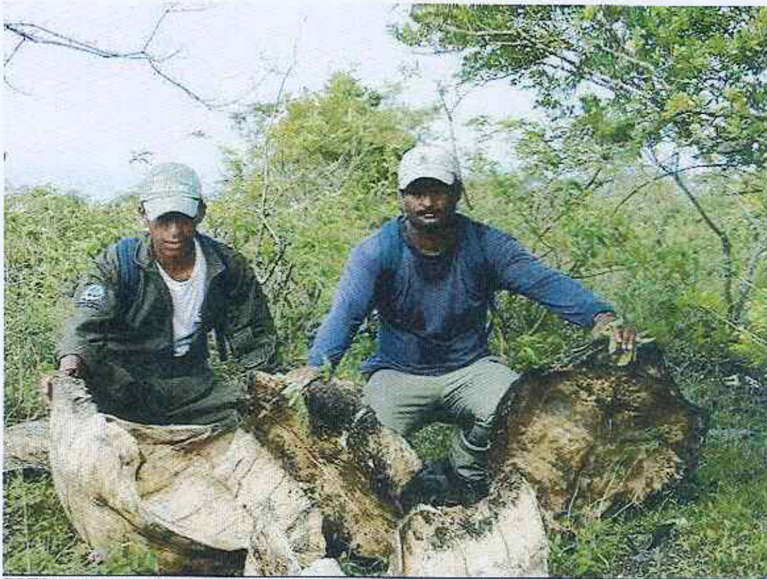
FOTO 5. Restos de dos tortugas gigantes hembras adultas sacrificadas en la zona de Caleta Iguana – volcán Cerro Azul (15 días de muertas). 1 de febrero de 2006.