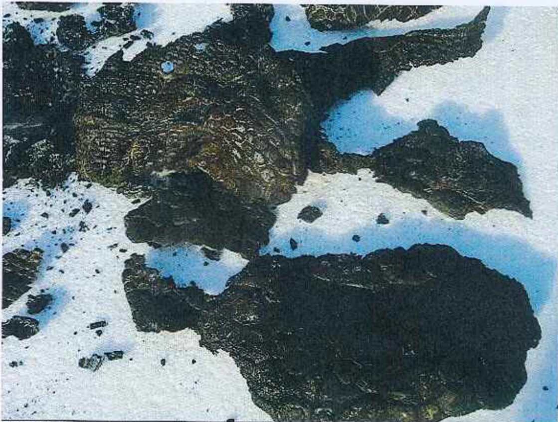
FOTO 2. Restos de tortuga gigante (piel de las patas) macho adulto sacrificado en la zona de La Lianta – Volcán Sierra Negra (1 día de muerta). 1 de febrero de 2005.