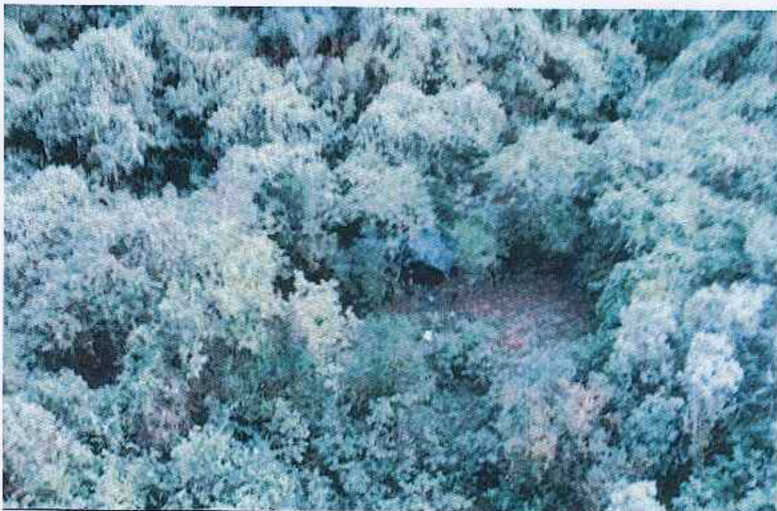
FOTO 10. Campamento permanente de cazadores locales (techo con plástico negro) ubicado en la zona de El Solitario – Volcán Sierra Negra. 22 de noviembre de 2012.