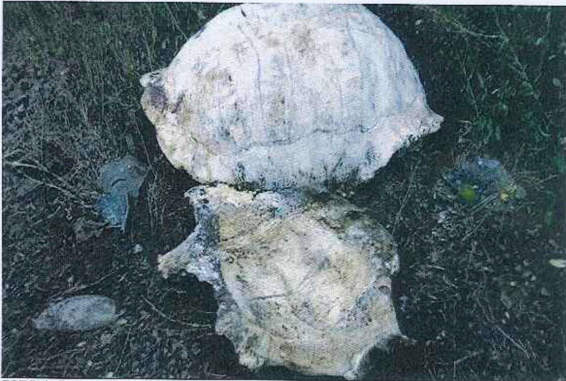
FOTO 1. Restos de tortuga gigante (caparazón y plastrón) macho adulto sacrificado en la zona de El Solitario – Volcán Sierra Negra (15 a 20 días de muerta). 22 de noviembre de 2012.