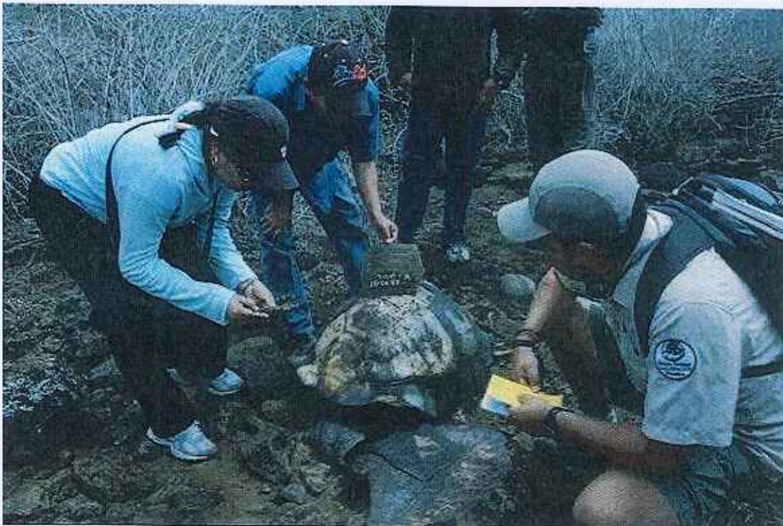
FOTO 6. Restos de tortugas gigantes sacrificadas en la zona de Roca Unión – Volcán Sierra Negra (30 días de muertas). 3 de julio de 2007. Inspección realizada en conjunto con la Fiscalía de Santa Cruz, la Unidad de Policía Ambiental y el Departamento Jurídico de la Dirección del Parque Nacional Galápagos. 14 tortugas gigantes fueron sacrificadas al mismo tiempo.