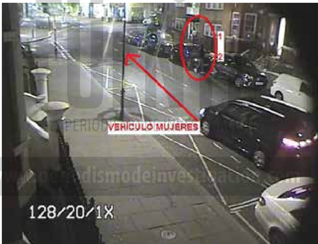
APARECE EL SEGUNDO SOSPECHOSO