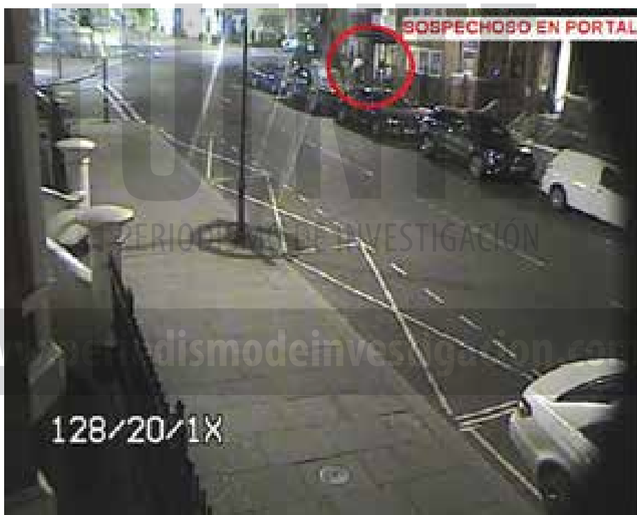
PRIMER SOSPECHOSO CRUZANDO A LA ACERA DE ENFREENTE DE LA EMBAJADA